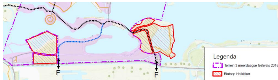
Figuur 3 Locatie van natuurlijke habitat van de heikikker